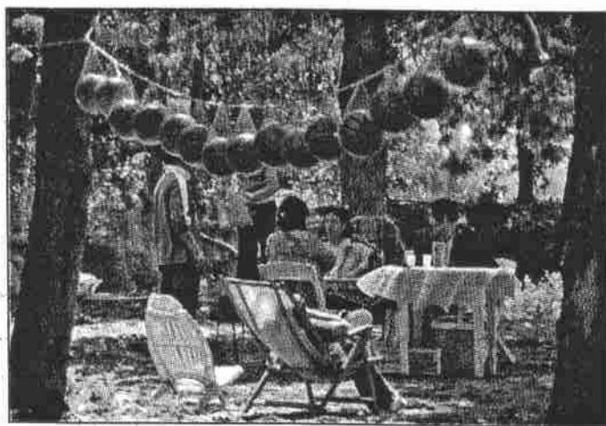
Primo maggio alla Favorita

Il giudice: ha ragione l'Albaria non entrano nella concessione